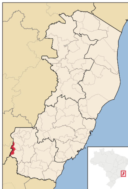
Figura 1 Mapa de Localização – Município de Dores do Rio Preto/ES

No que tange, a topografia, segundo dados do INCAPER - Instituto Capixaba de Pesquisa, Assistência Técnica e Extensão Rural, a Sede de Dores do Rio Preto apresenta uma altitude que varia de 400 a 2.400 m.